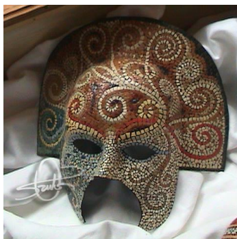
6. ábra. Szutor Gabriella tojánhéj-mozaik (Egy emberi arcmaszok színes tojánhéjdarabokból kirakva)