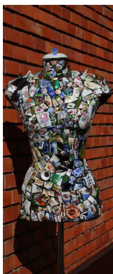
5. ábra. Szász Károly mozaik (A próbababa-torzó felületét apró, színes porcelándarabok fedik)

ahonnan jöttek, más formát öltenek a jelenben, és egy újabb patchworkben újabb jelentésre lennének. Hozzájuk kapcsolódnak további materiális és diszkurzív elemek: ételfoltok, emlékek, kiszakadt öltések új fonalai vagy hiányai. A szövegben a patchwork és a mozaik szót egymás szinonimájaként alkalmazom. Egyrészt azért, mert az angol patchwork szót magyarra foltmozaiknak is fordítják, másrészt mert a mozaik metaforája is át-meg átjárja a munkánkat, a patchwork jelentésével. Pl. az alábbi két képet (egy porcelánmozaikot és egy tojánhéjmozaikot) kaptam Zsuzsától a patchworköt koncepcionális középpontba állító gondolatomat támogatva.