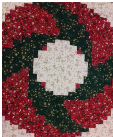
4. ábra. Egy patchworkterítő képe Zsuzsa nappalijának asztaláról

Ahogy a módszertani részben említettem, az etnográfiai interjúk Zsuzsa otthonában kerültek felvételre. Egy kerek faasztalnál ültünk egymással szemben. Az asztalon minden esetben egy patchwork-terítő feküdt: erre tettem rá a laptopomat, a jegyzeteimet, a diktafont. Bizonyos értelemben ez szolgáltatta az „alapot” a munkánknak, és bennünket is összekötött. Az idő múlásával a patchworkök nem csupán terítőként jelentek meg, hanem behálózták a munkánkat: kaptam Zsuzsától egy patchwork-mamuszt és egy patchwork-neszesszert, és felfigyeltem rá, hogy a lakása többi részének felületeit is változó összeállítású patchworkök díszítik. Mindezek Olga néninek (köszönet érte!), Zsuzsa Édesanyjának a keze munkái.