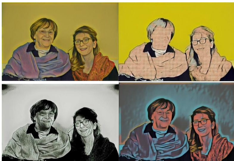
1. ábra. A kutatótársak színei és vonalai

gyakorlat) felszabadító következményeinek bemutatása mellett a fejezet rámutat kritikáira és a feminista gondoskodási etika befolyása révén kiegészült újraértelmezésére. Ez a megközelítés a relációs ontológia alaptéziseinek bázisán a függőség és a függetlenség dichotómikus értelmezésén túllép, és a személyi segítségben megjelenő kapcsolódásokra fókuszálva keretezi újra a fogalmat. Ennek az újragondolásnak az elméleti eszköze az assamblage fogalma (Deleuze és Guattari, 1987), amely lehetővé teszi, hogy azt vizsgáljuk, milyen kulturális imperatívuszok és törésvonalak, határok és határátlépések alapozzák és keretezik a személyes kapcsolódásokat emberekkel, tárgyakkal, fogalmi, tapasztalati rendszerekkel a személyi segítség együttműködésének mindennapi megéléseiben. Továbbá, hogy milyen interperszonális és lokális, illetve reprezentációs hatalmi mechanizmusok generálják és fejtik fel e kapcsolódások interszekcionális dimenzióit a hétköznapi narratíváiban. Mindezekből kiemelkednek különböző összekötő és elhatároló vonalak, színek és hangok, amelyek mindannyiunk számára hasonlób-különbözőbb képekké, élesebb-homályosabb kapcsolódássá formálódnak az olvasás során.